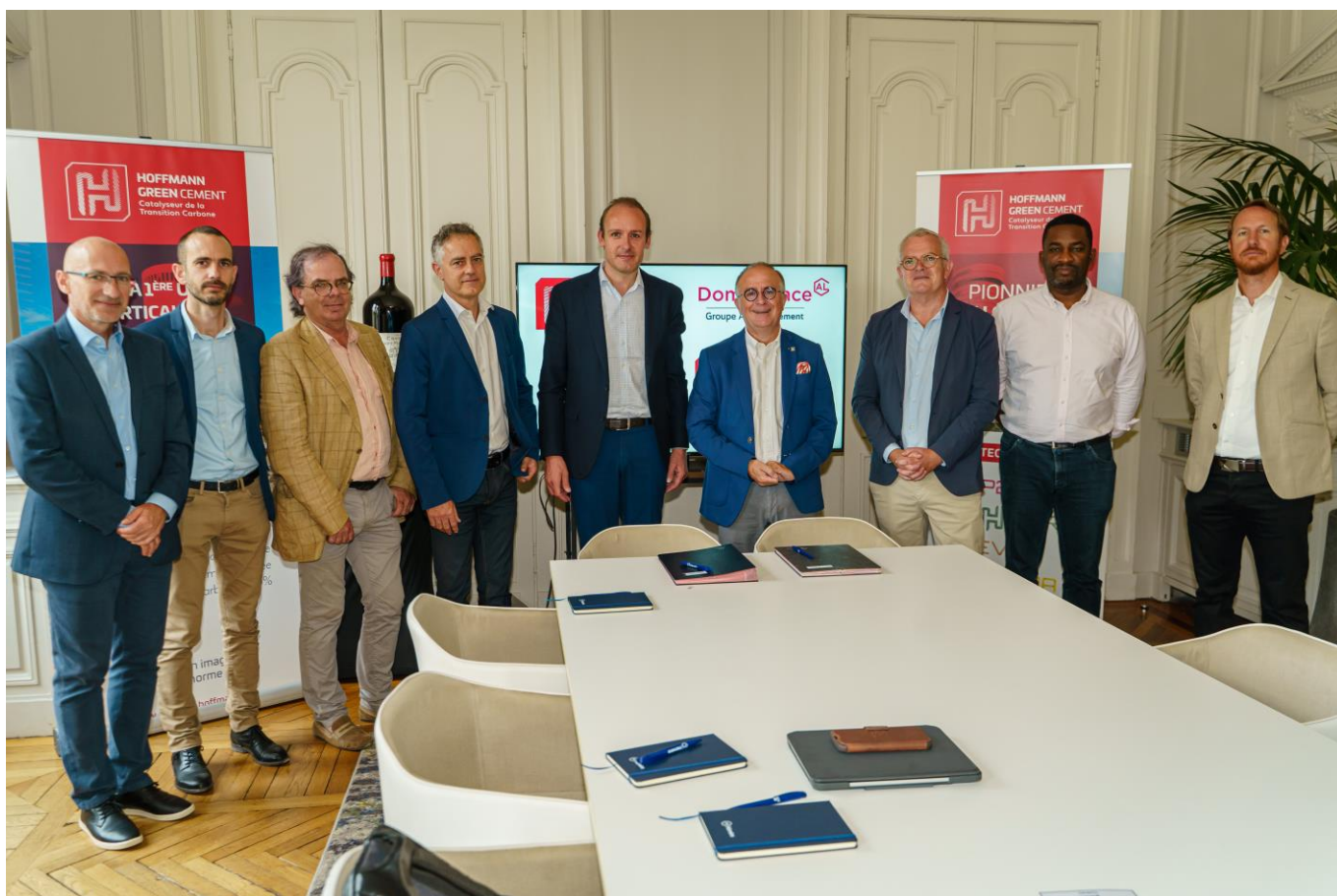
Les équipes de management de Domofrance et d'Hoffmann Green

Distingué pour ses engagements en matière de Responsabilité Sociétale des Entreprises avec l'obtention en 2021 du label B Corp, une première pour un bailleur social. Domofrance poursuit cette dynamique en s'engageant à prescrire les bétons à base de ciments Hoffmann 0% clinker.