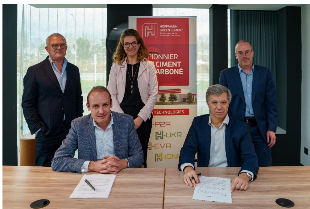
Les équipes de management d'Hoffmann Green Cement et du Groupe Alkern

Le Groupe Alkern réalisera notamment des pavés, des bordures et du mobilier urbain avec les ciments Hoffmann.