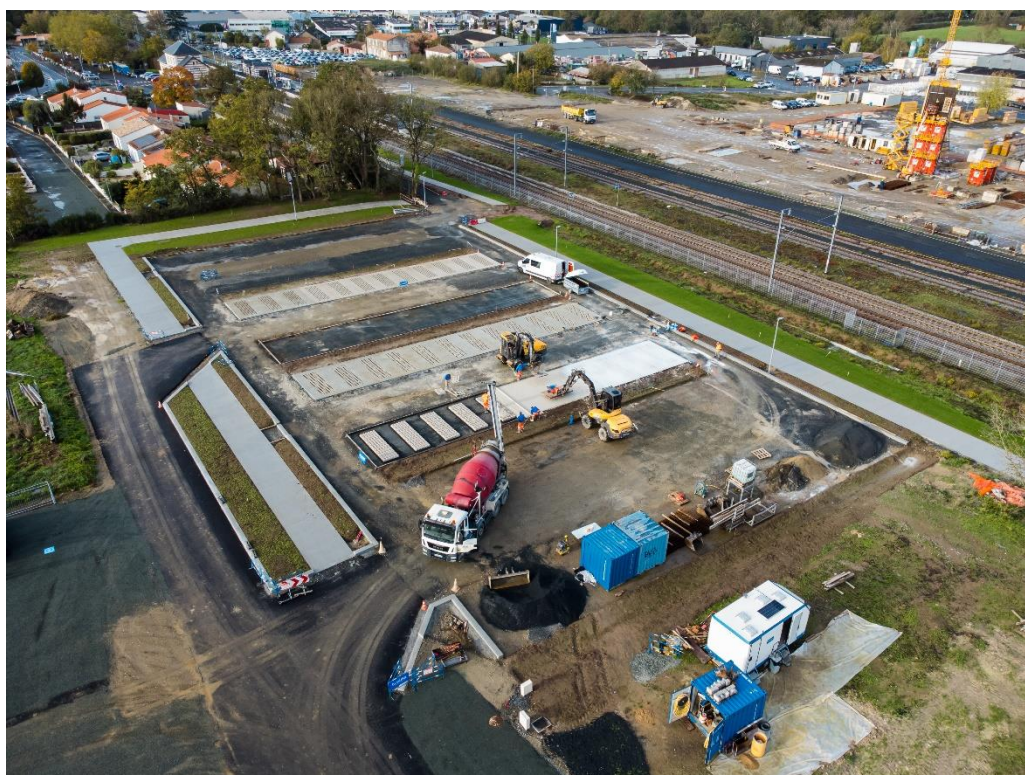
Pose de béton désactivé élaboré à partir de ciment H-UKR sur le parking de la gare de Montaigu (85)

Dans le cadre du partenariat signé avec le Groupe Nivet et à la suite de nombreux essais qui se sont révélés très concluants, les coulages de béton désactivé pour la construction du parking la gare de Montaigu en Vendée (85) sont réalisés à partir du ciment H-UKR d'Hoffmann Green. L'utilisation du ciment 0% clinker permet de diviser par deux l'ensemble des émissions carbonées par rapport à un ciment traditionnel CEM III/A sur ce chantier.