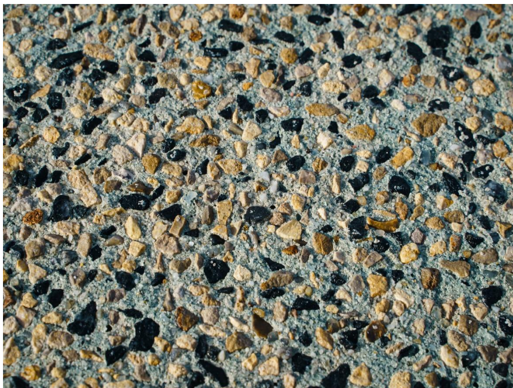
Béton désactivé élaboré à partir de ciment H-UKR